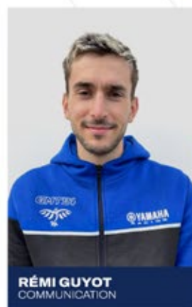
RÉMI GUYOT COMMUNICATION