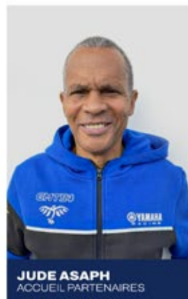
JUDE ASAPH ACCUEIL PARTENAIRES